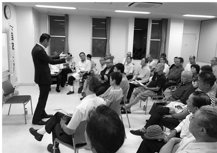
政治よろず座談会は双方向のやりとりが特徴です

座談会では、時節柄、北朝鮮のミサイル実験に関することや、核問題、戦争に関する質問が多く寄せられました。地域の皆様が、わが国の平和を維持することに対し、大きな心配をしていることを、直接の対話の中で強く実感いたしました。皆様の声は、自民党の政策会議や衆議院の委員会を通じて、国政に反映されるようしっかり伝えて参ります。今回開催できなかった地域でも今後座談会を開催していく予定です。皆様のご参加お待ちしております。