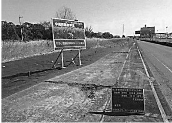
除草シート防草効果確認試験の様子

東埼玉道路は、現在、八潮市～吉川市区間の延長 5.7 km が開通し、 吉川市開通区間終点部から春日部市国道 4 号接続部までの延長 8.7 km の整備を進めています。 ご要望の多い除草について、大宮国道事務所と協議を重ねた結果、今年 2 月より、試験箇所を 2 ヲ所（①そうか公園～草加東高校、②レイクタウン北～大成橋南）を選定し、 防草シートの防草効果の確認試験 を行っております。