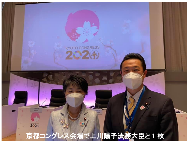
京都 कांग्रेस 会場で上川陽子法務大臣と1枚