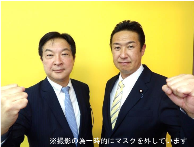
※撮影の為一時的にマスクを外しています

友党・公明党は、自民党にとって、連立政権共に支える重要なパートナーです。各選挙区でも、政策実現に向け、積極的に連携しています。